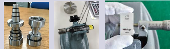
機械検査 実技課題