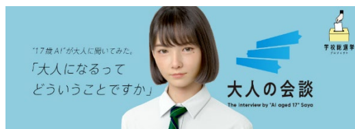
学校総選挙プロジェクト「大人の会談」特設サイト

マルチモーダル対話システムが Saya というキャラクタを持ったことで、究極的な人らしさを出す目標ができました。映像での体や表情の動きもさることながら、対話における発話内容や言い回し、音声合成の声質のみならずイントネーション・アクセントのわずかな不自然さも、Saya らしさを失わせかねません。より細やかな表現ができるように、様々な側面から改良をしていきます。そして将来的に様々な場面で人と対話し、人と共生し、人を助けるための機械のインターフェースとなっていくことを目指します。