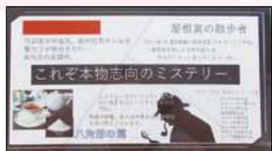
「これぞ本物志向のミステリー」