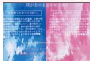
「僕が君の名前を呼ぶから」